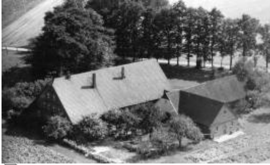
Hof Kruse Luftbild ca. 1960